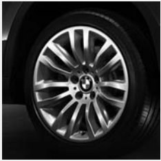
Doppelspeiche 321 Seite 6