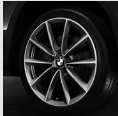
V-Speiche 324 Ferricgrey Seite 6