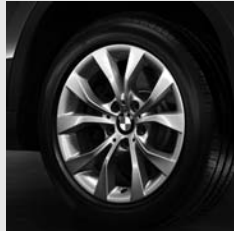
V-Speiche 318 Seite 6