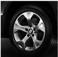
Sternspeiche 317 Seite 6