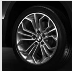
Wabenstyling 323 Seite 6