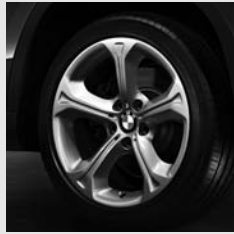
Sternspeiche 320 Seite 6