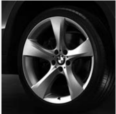
Sternspeiche 311 Seite 6