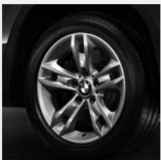
Sternspeiche 319 Seite 6