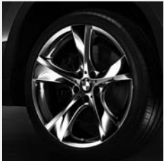
Sternspeiche 311 Chrom Seite 6